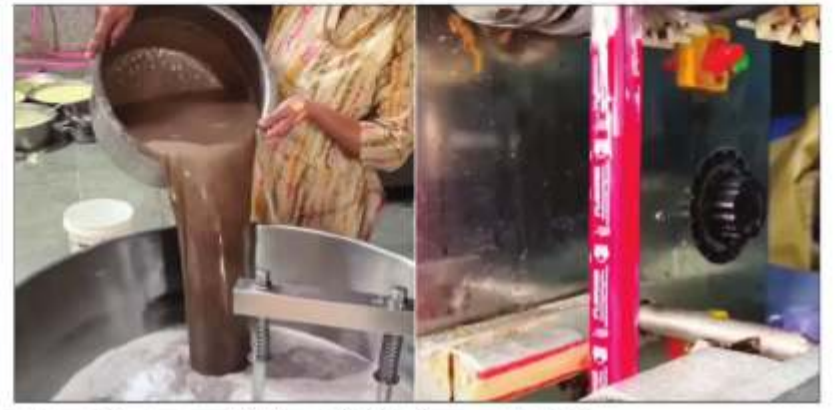
सोशल मीडिया पर चुस्की पैकेट्स के वीडियो वायरल हो रहे हैं।

जैसे ही गर्मी ने अपना रंग दिखाना शुरू किया, सोशल मीडिया पर भी उसी के हिसाब से वीडियो शेयर होने लगे हैं। कहीं मिट्टी पर पापड़ सेंकने वाली महिला के वीडियो आ रहे हैं तो कहीं कोल्ड ड्रिंक से जुड़े वीडियो शेयर हो रहे हैं। इसी बीच, सोशल प्लेटफॉर्म पर 1 रुपये वाली चुस्की के वीडियो भी शेयर हो रहे हैं, जिनमें दिखाया जा रहा है कि आखिर इसे कैसे बनाया जाता है। इन वीडियो पर कई लोग कमेंट कर रहे हैं कि इन वीडियो ने बचपन की याद दिला दी जबकि कुछ लोग इस चुस्की को बनाए जाने के तरीके पर बात कर रहे हैं। वीडियो में दिख रहा है कि इन्हें बहुत ही गंदे तरीके से बनाया जा रहा है। तो आज इन वीडियो के जरिए देखते हैं कि आखिर 1 रुपये वाली चुस्की कैसे बनती है। वायरल हो रहे वीडियो