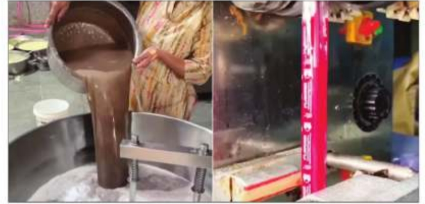
सोशल मीडिया पर चुस्की पैकेट्स के वीडियो वायरल हो रहे हैं।

जैसे ही गर्मी ने अपना रंग दिखाना शुरू किया, सोशल मीडिया पर भी उसी के हिसाब से वीडियो शेयर होने लगे हैं। कहीं मिट्टी पर पापड़ सेंकने वाली महिला के वीडियो आ रहे हैं तो कहीं कोल्ड ड्रिंक से जुड़े वीडियो शेयर हो रहे हैं। इसी बीच, सोशल प्लेटफॉर्म पर 1 रुपये वाली चुस्की के वीडियो भी शेयर हो रहे हैं, जिनमें दिखाया जा रहा है कि आखिर इसे कैसे बनाया जाता है। इन वीडियो पर कई लोग कमेंट कर रहे हैं कि इन वीडियो ने बचपन की याद दिला दी जबकि कुछ लोग इस चुस्की को बनाए जाने के तरीके पर बात कर रहे हैं। वीडियो में दिख रहा है कि इन्हें बहुत ही गंदे तरीके से बनाया जा रहा है। तो आज इन वीडियो के जरिए देखते हैं कि आखिर 1 रुपये वाली चुस्की कैसे बनती है। वायरल हो रहे वीडियो