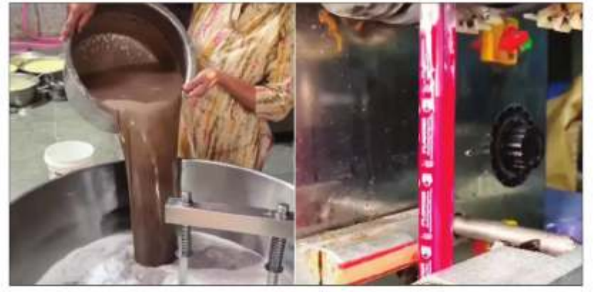
सोशल मीडिया पर चुस्की पेकेट्स के वीडियो वायरल हो रहे हैं।

जैसे ही गर्मी ने अपना रंग दिखाना शुरू किया, सोशल मीडिया पर भी उसी के हिसाब से वीडियो शेयर होने लगे हैं। कहीं मिट्टी पर पापड़ सेंकने वाली महिला के वीडियो आ रहे हैं तो कहीं कोल्ड ड्रिंक से जुड़े वीडियो शेयर हो रहे हैं। इसी बीच, सोशल प्लेटफॉर्म पर 1 रुपये वाली चुस्की के वीडियो भी शेयर हो रहे हैं, जिनमें दिखाया जा रहा है कि आखिर इसे कैसे बनाया जाता है। इन वीडियो पर कई लोग कमेंट कर रहे हैं कि इन वीडियो ने बचपन की याद दिला दी जबकि कुछ लोग इस चुस्की को बनाए जाने के तरीके पर बात कर रहे हैं। वीडियो में दिख रहा है कि इन्हें बहुत ही गंदे तरीके से बनाया जा रहा है। तो आज इन वीडियो के जरिए देखते हैं कि आखिर 1 रुपये वाली चुस्की कैसे बनती है। वायरल हो रहे वीडियो