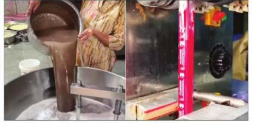
सोशल मीडिया पर चुस्की पैकेट्स के वीडियो वायरल हो रहे हैं।

जैसे ही गर्मी ने अपना रंग दिखाना शुरू किया, सोशल मीडिया पर भी उसी के हिसाब से वीडियो शेयर होने लगे हैं। कहीं मिट्टी पर पापड़ सेंकने वाली महिला के वीडियो आ रहे हैं तो कहीं कोल्ड ड्रिंक से जुड़े वीडियो शेयर हो रहे हैं। इसी बीच, सोशल प्लेटफॉर्म पर 1 रुपये वाली चुस्की के वीडियो भी शेयर हो रहे हैं, जिनमें दिखाया जा रहा है कि आखिर इसे कैसे बनाया जाता है। इन वीडियो पर कई लोग कमेंट कर रहे हैं कि इन वीडियो ने बचपन की याद दिला दी जबकि कुछ लोग इस चुस्की को बनाए जाने के तरीके पर बात कर रहे हैं। वीडियो में दिख रहा है कि इन्हें बहुत ही गंदे तरीके से बनाया जा रहा है। तो आज इन वीडियो के जरिए देखते हैं कि आखिर 1 रुपये वाली चुस्की कैसे बनती है। वायरल हो रहे वीडियो